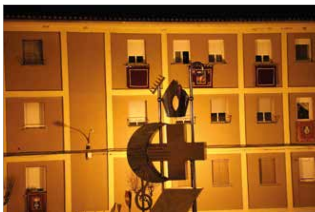
Manolo P. Esplugues

Tornem a retrobar-nos ací, al nostre programa que amb molta cura i dedicació preparem per a apropar-los a tot el que vincula al nostre poble de Bocairent: les seues festes, les associacions i entitats que la conformen, la seua història, etc. No volem deixar avançar més aquest llibre sense agrair-los a tots els qui heu fet la vostra aportació perquè aquest llibre-revista veja la llum un any més amb un repertori de material tan ric i divers.