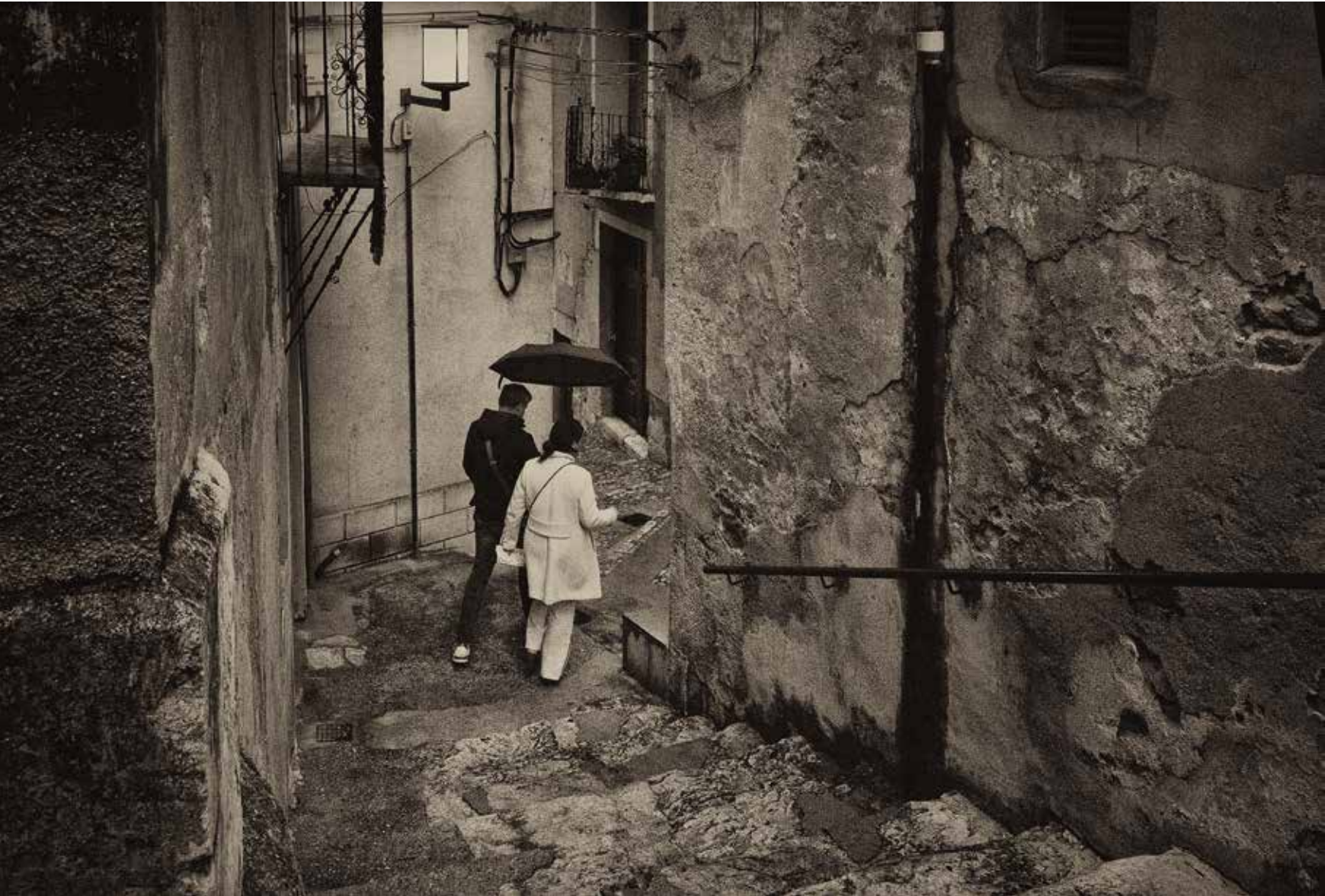
2n premi bn. Concurs "Bocairent i el seu entorn" 2023. Títol: "Foto II". Autor: Eduardo Francés Sanchis